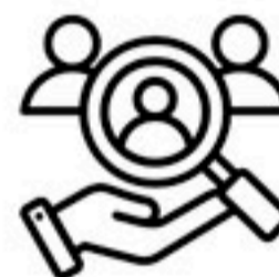
Encargados de RH